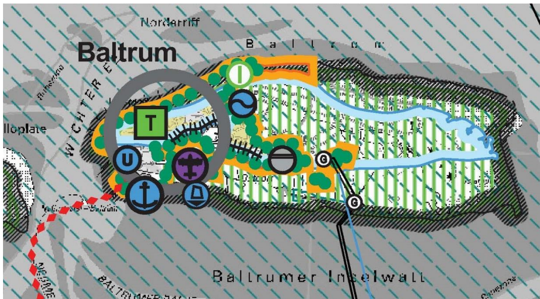
Abb. 2: Auszug aus dem RROP o. M.

Für den westlichen Teil der Insel werden im RROP eine Reihe von Darstellungen getroffen. Dies sind: